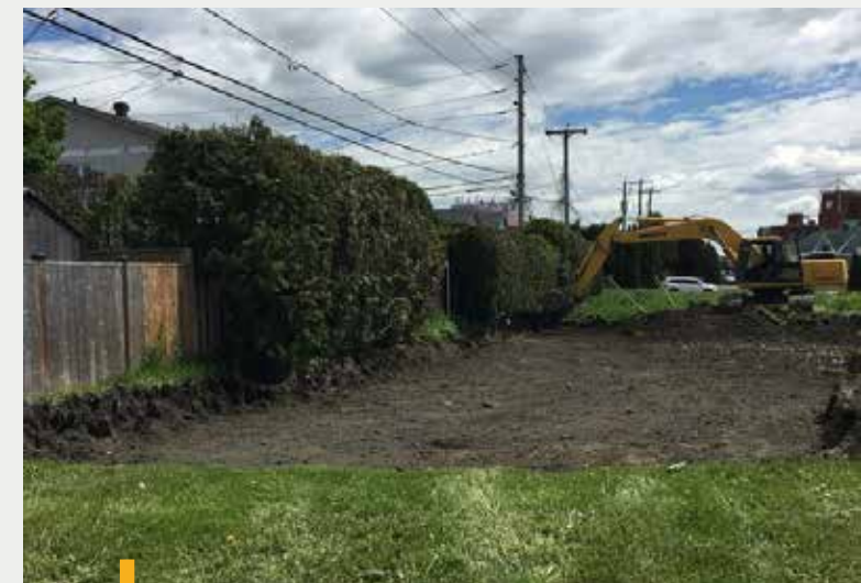
Terrain de futurs bureaux de l'OH Outaouais

Le déménagement des bureaux de l'OH Outaouais permettra d'améliorer ses services à la clientèle en rapatriant toutes les équipes dont l'une est située au 117, rue Carillon et l'autre au 227, chemin de la Savane.