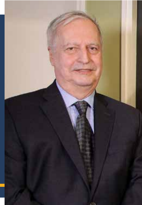
PRÉSIDENT Alain Boucher