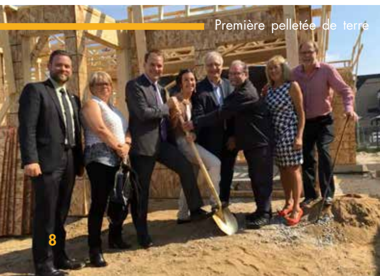
Première pelletée de terre

En plus d'une architecture charmante, le projet Oak est une belle réussite au niveau de l'abordabilité des loyers. Ce projet particulier n'est pas issu d'un programme gouvernemental.